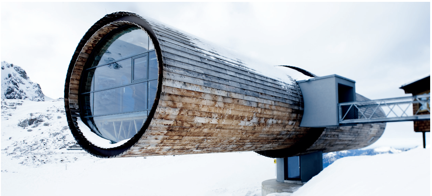
Bergstation Karwendel, Mittenwald

Dabei sind alle ORNILUX® Gläser wie andere Isoliergläser oder Verbundsicherheitsgläser ohne besondere technische Vorbedingungen oder Spezialwerkzeug einzubauen. Außerdem ist die Kombination mit anderen Funktionen wie Schall- und Wärmedämmung sowie Sonnenschutz problemlos möglich.